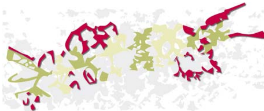
Bildzeile: Schematische Darstellung der Erweiterungsflächen des Emscher Landschaftsparks 2002 und 2006